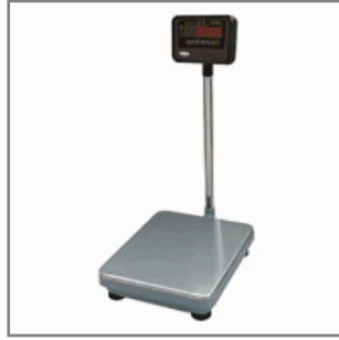
BAV DMI-610 ABS

Básculas monocélula: Estructura de acero o aluminio, célula de aluminio, plato de acero inoxidable.